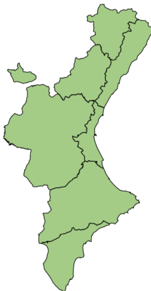
Fig. 2: Mapa niveles preemergencia (colores) Fig. 2: Mapa nivells preemergència (colores)

La información del nivel de preemergencia ante el riesgo de incendios forestales está disponible en www.112cv.gva.es . Queda prohibida la quema de residuos vegetales generados en el entorno agrario o selvícola en terreno forestal y su Zona de Influencia Forestal durante el periodo comprendido entre el 1 de junio y el 15 de octubre , ambos inclusive , salvo que esta actividad se contemple en un plan local de quemas aprobado por el órgano competente en zonas de bajo riesgo, con nivel de preemergencia 1 y hasta las 11 horas como máximo.